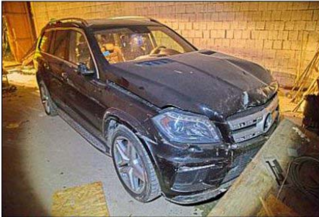
Selbst nach der Fahrt durch die Bretterwand der Scheune blieben die Fahrerin, ihr Sohn und ihr Mann unverletzt.